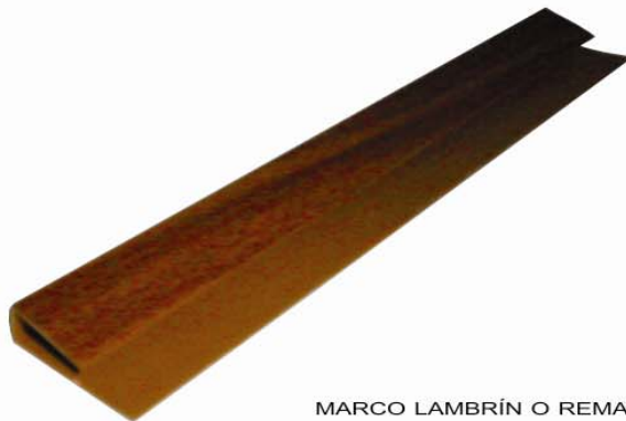
MARCO LAMBRÍN O REMATE MEDIDAS: 1.7 cm. x 9 mm. x 3.1 cm. PRESENTACIÓN: PAQUETES DE 20 PIEZAS DE 6 M.