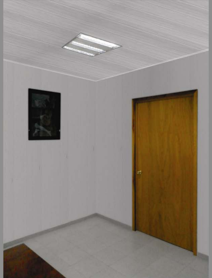
MUROS REVESTIDOS CON LAMBRÍN