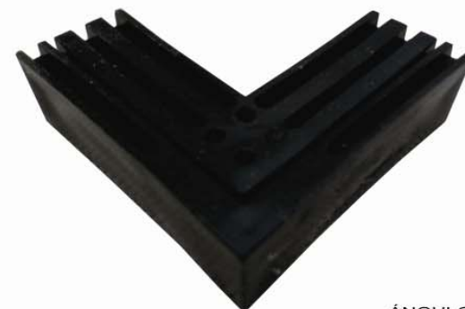
ÁNGULO 90° MEDIDAS: 5.5 cm. x 5.5 cm. x 2 cm. PRESENTACIÓN: PAQUETE CON 20 PIEZAS.