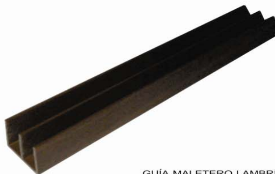
GUÍA MALETERO LAMBRÍN MEDIDAS: 2.6 cm. x 1.9 cm. PRESENTACIÓN: PAQUETE CON 20 PIEZAS DE 6 m.