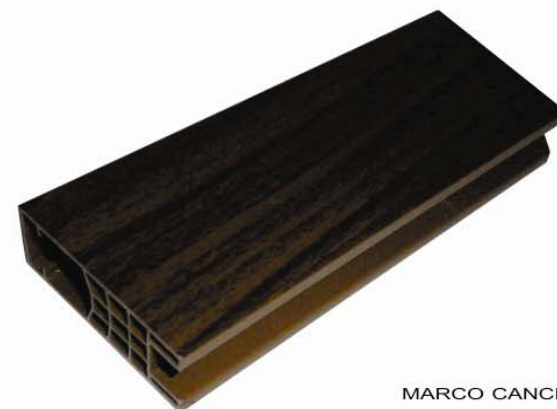
MARCO CANCEL MEDIDAS: 2 cm. x 6 cm. PRESENTACIÓN: PAQUETE CON 10 PIEZAS DE 6 m.